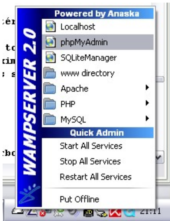
Accès à phpMyAdmin

Cliquez sur l'icône de WampServer, puis cliquez sur phpMyAdmin .