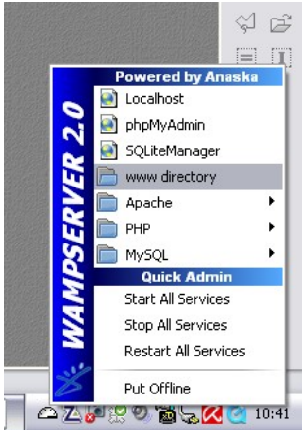
l'interface graphique du serveur wamp

Dans la fenêtre qui s'ouvre, créez un dossier PHP et glissez-y votre fichier test.php.